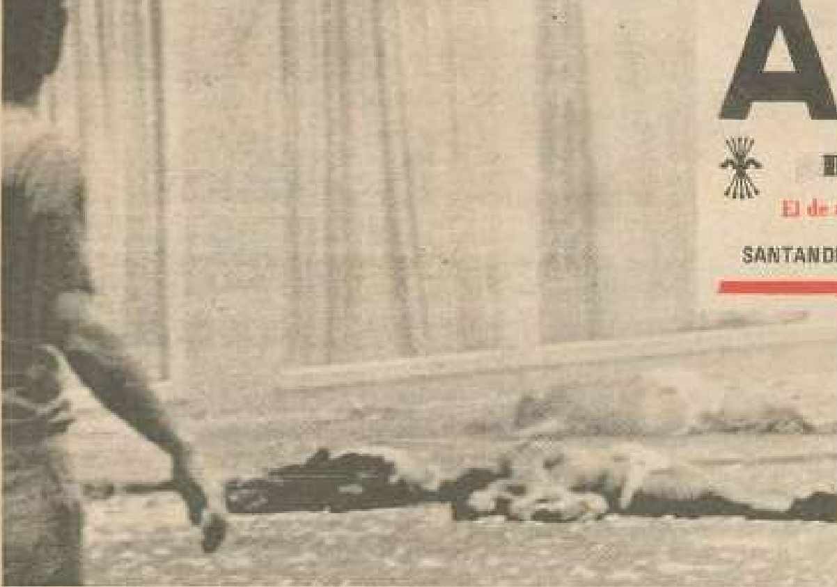
En la foto, algunos de los cadáveres de las víctimas del incendio de Sao Paulo, que perecieron al arrojarse por las ventanas del edificio.