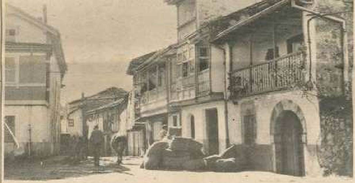
En la Merindad de Trasmiera, integrando la Junta de Sierrevilla, el Valero se encuentra con el municipio de Escalante, que es uno de los más pequeños (en extensión) de la Montaña. Con la categoría de villa, Escalante es, sobre todo, barrio (once diminutos poblados en torno a la capital del municipio), y en la historia de Cantabria tiene este tipo de la Montaña verde una gran tradición. De todos sus atractivos queda constancia en las páginas 10 y 11, dentro de la serie dominical "La Montaña de la A a la Z".